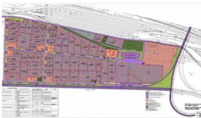
Πλάνο της σχεδιαζόμενης βιομηχανικής ζώνης

Μια νέα βιομηχανική ζώνη σχεδιάζεται να δημιουργηθεί στο Μπουργκάς από τον τοπικό δήμο και την κρατική εταιρία "National Company Industrial Zones (NCIS)". Η νέα ζώνη θα ονομάζεται «Logistics and Industrial Park - Burgas» και θα βρίσκεται στην περιοχή της ήδη εν λειτουργία βιομηχανικής ζώνης «Burgas-North». Η πρόταση για σύσταση κοινοπραξίας με την ως άνω κρατική εταιρία έχει, μάλιστα, ήδη κατατεθεί στο δημοτικό συμβούλιο. Ο δήμος του Μπουργκάς θα συμμετέχει στην κοινοπραξία παρέχοντας το χώρο για τη δημιουργία της νέας βιομηχανικής ζώνης, ενώ η NCIS θα προσφέρει τη χρηματοδότηση για την κατασκευή της. Ο δήμος έχει ήδη προχωρήσει στην απαλλοτρίωση των απαιτούμενων εκτάσεων, ενώ έχει εξασφαλιστεί και χρηματοδότηση από την ΕΕ ύψους €2,4 εκατ. για την κατασκευή του απαιτούμενου οδικού δικτύου.